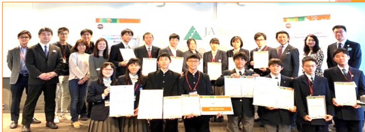
2019年度国内大会参加チーム集合写真（上）